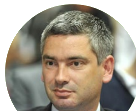
Boris Miletić župan Istarske županije