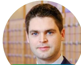
Karlo Ressler zastupnik u EP