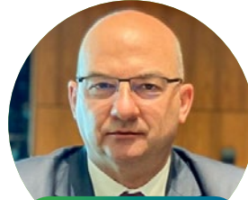
Ivo Milatić državni tajnik