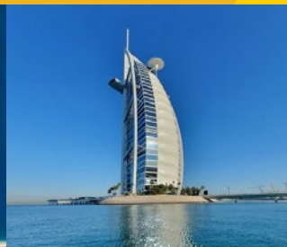
Burj Al Arab