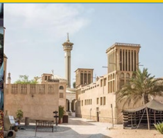
Al Fahidi četvrt